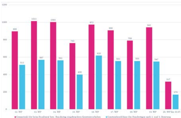
Gesetzesinitiativen und Gesetzesbeschlüsse 12.-20. Wahlperiode (1990-2023)