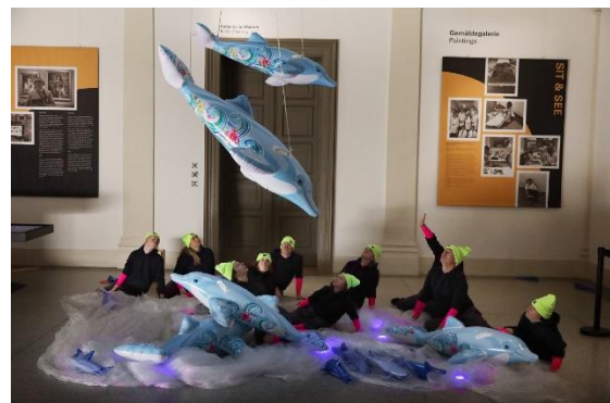
Performance im Herzog Anton-Ulrich-Museum

Aktuelle Projekte und Termine, ausführliche Informationen, Filme und Fotos zu der einzigartigen Zusammenarbeit mit der esistso!company unter www.kunasmodernus.de