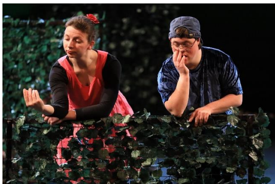
Inklusives Team der esistso!company

Bei der Finanzierung bis hin zur Barrierefreiheit kann die Politik entscheidende Weichen stellen, bei der Sichtbarkeit kann sie uns gut unterstützen, für die Teilhabe in der Gesellschaft brauchen wir alle.