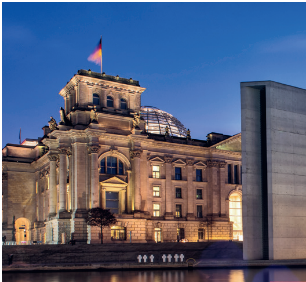
Die Ostseite des Reichstagsgebäudes im Spreebogen in Berlin, seit 1999 Sitz des Deutschen Bundestages. Rechts die Rückseite des Paul- Löbe-Hauses.