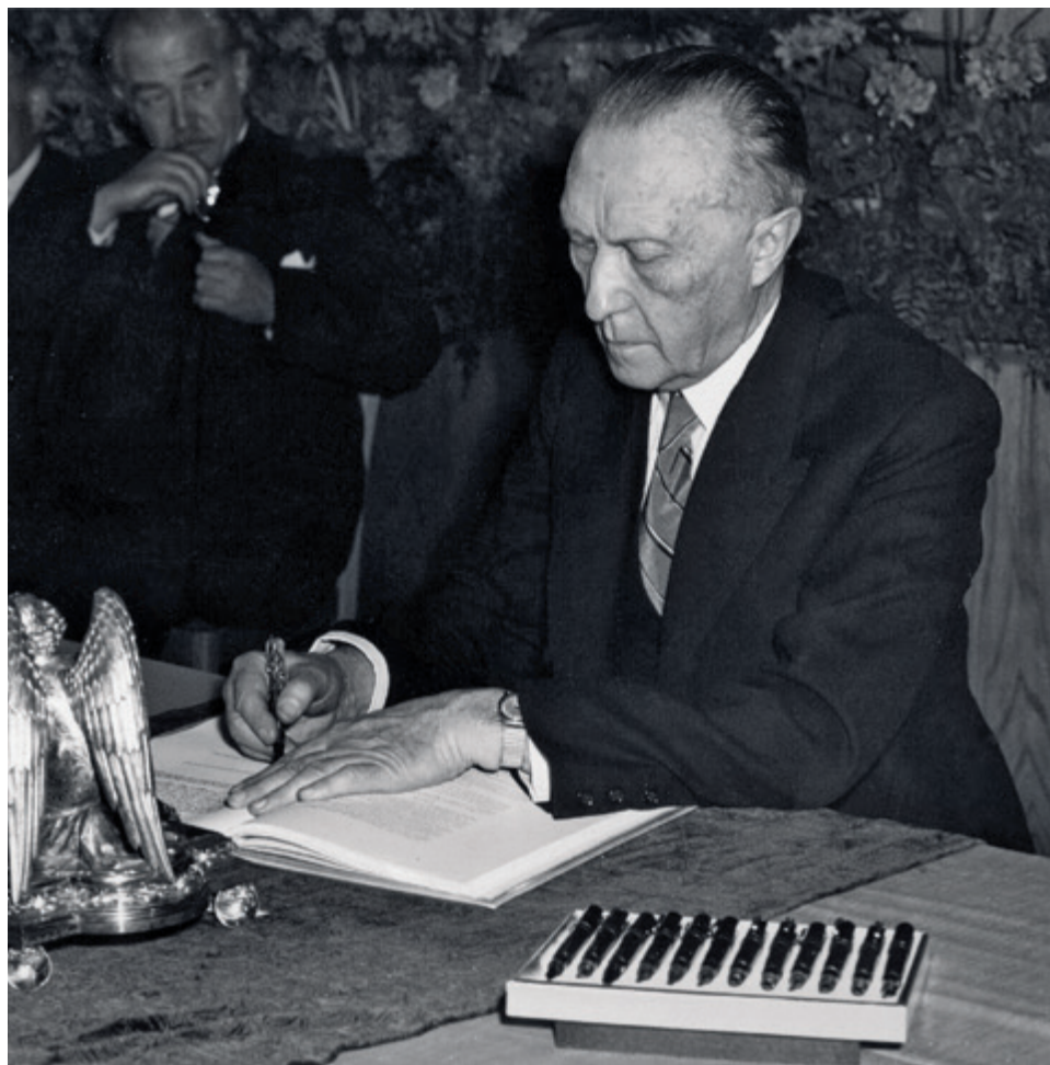
Dr. Konrad Adenauer, Präsident des Parlamentarischen Rates, unterzeichnet am 23. Mai 1949 in Bonn das Grundgesetz.