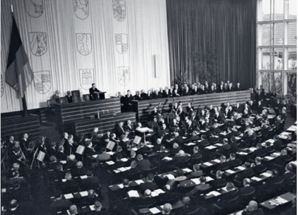
Konstituierende Sitzung des ersten Deutschen Bundestages am 7. September 1949 in einem neu errichteten Anbau zur der ehemaligen Pädagogischen Akademie in Bonn.