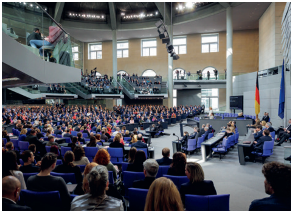
Konstituierende Sitzung des 21. Deutschen Bundestages am 25. März 2025 im Reichstagsgebäude in Berlin.