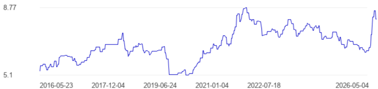
China Diesel prices, liter, Chinese Renminbi

* A long flat line means that the government fixes the prices.