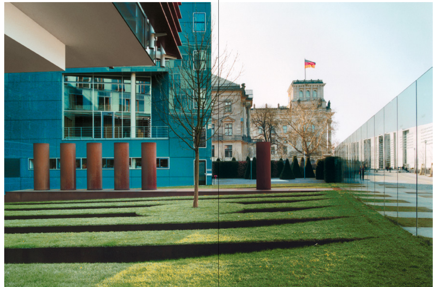
Dani Karavan, geb. 1930 in Tel Aviv, lebt und arbeitet in Tel Aviv, Paris und Florenz