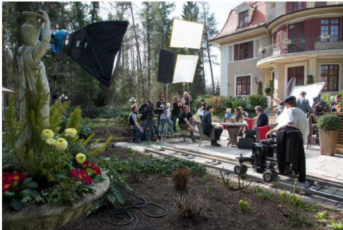
Set von „Sturm der Liebe“