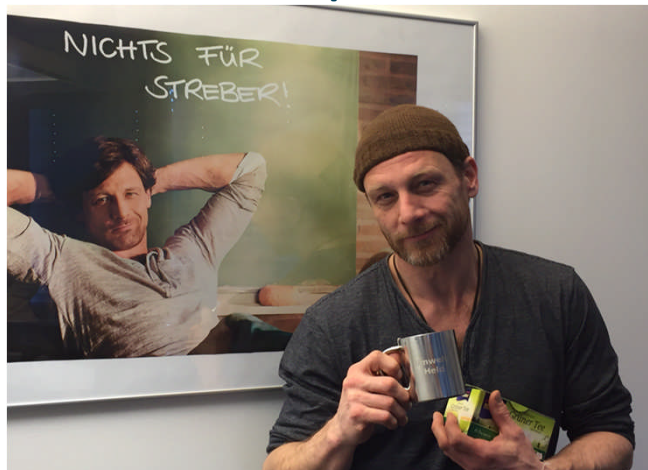
Set von „Der Lehrer“