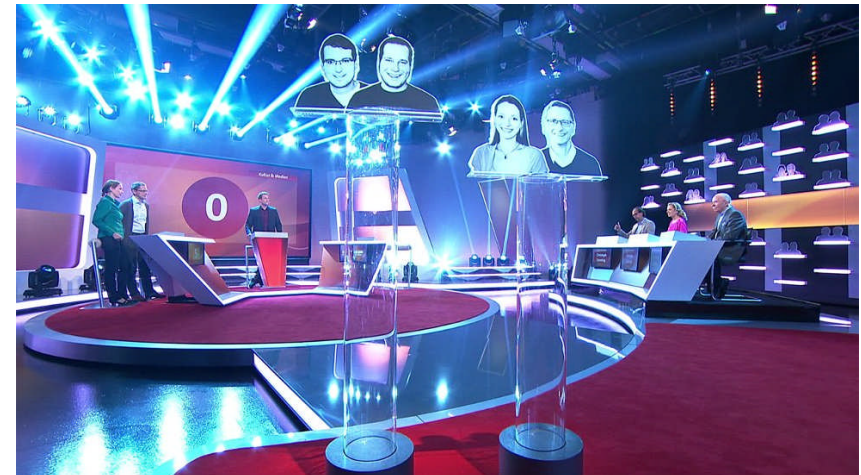
Studio mit Showlight