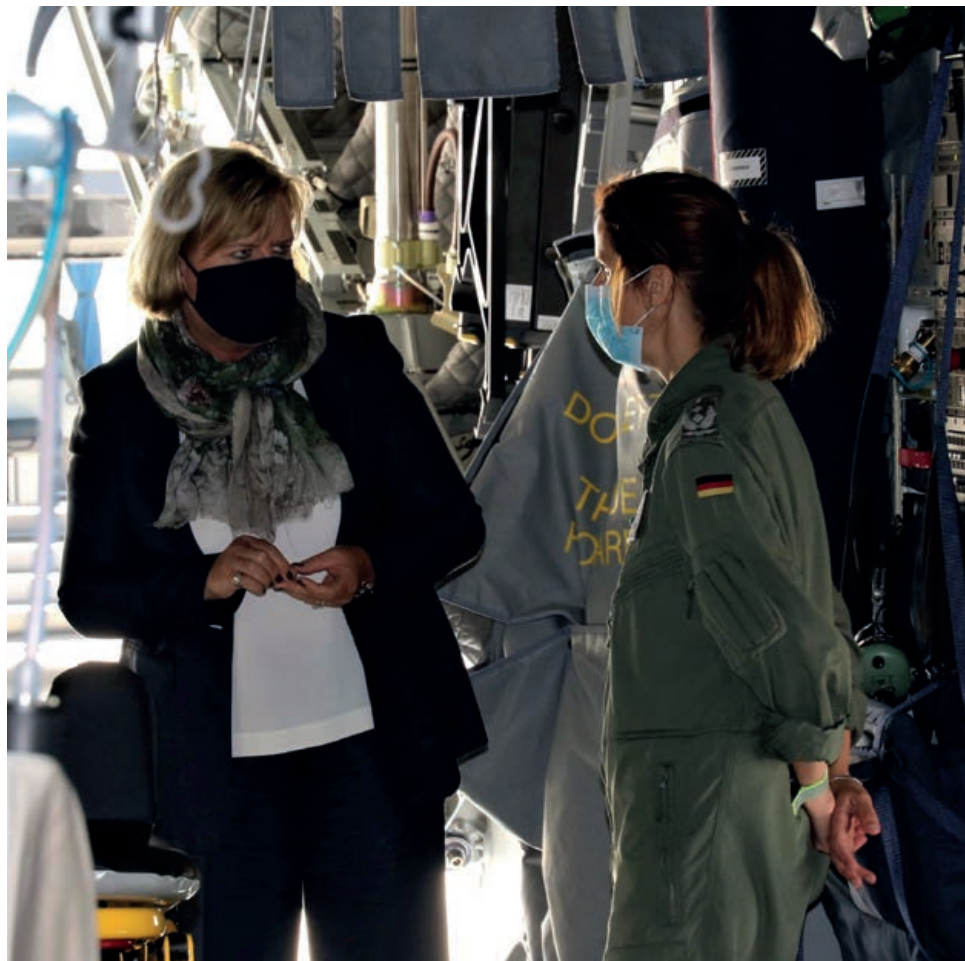
Беседа с экипажем на борту самолета А400М транспортного авиационного полка в городе Вунсторф. Военно-транспортный самолет А400М используется также для выполнения задач по эвакуации раненых и больных солдат из районов боевых действий.