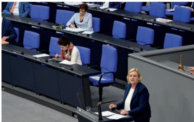
Выступление Уполномоченного Германского Бундестага по делам военнослужащих 19 июня 2020 года в связи с публикацией годового отчета за 2019 г. На заднем плане в правительственном ряду (во втором ряду) Федеральный министр обороны Аннегрет Крамп-Карренбауэр.

В годовом отчете, в частности, содержатся также важные указания о том влиянии, которое оказывают законодательные и прочие регулирования в части, касающейся принципов внутреннего руководства. Таким образом отчеты становятся для Парламента своего рода системой раннего предупреждения.