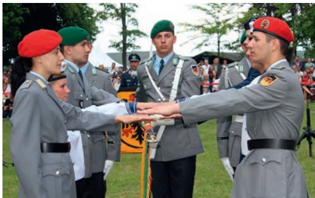
Гражданки и граждане в военной форме: военнослужащие бундесвера публично приносят присягу

Вместе с тем внутреннее руководство не исчерпывается конкретным применением действующих предписаний. Это в особой мере касается также отношения начальников к своим подчиненным в повседневной военной службе. Начальники должны управлять своими подчиненными не только следуя букве закона, но и «душой и разумом». Несущий службу в вооруженных силах, как гражданин в военной форме, должен быть свободной личностью, человеком, действующим как ответственный гражданин и проявляющим постоянную готовность к выполнению задания. От него требуется не слепое повиновение, а повиновение, основывающееся на понимании.