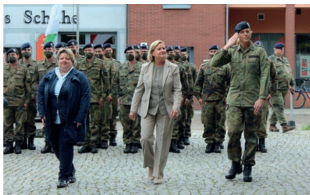
Уполномоченный по делам военнослужащих в городе Шторков 8 сентября 2020 года во время посещения батальона информационно-технического обеспечения номер 381. В ходе торжественной церемонии проводов на выполнение операции в Мали было отправлено примерно 100 военнослужащих.

Кроме того, для получения информации важное значение имеет право требовать представления отчетов об осуществлении дисциплинарной власти в