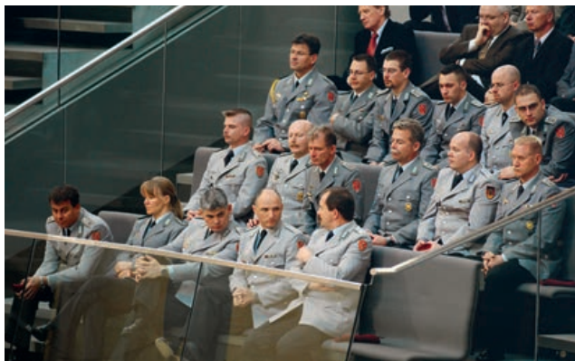
Посещение Парламента: солдаты бундсвера следят за заседанием Бундстага на трибуне для посетителей пленарного зала Бундстага.

Конкретно осуществление парламентского контроля в государствах с демократическим правлением развивалось порой совершенно по-разному. Развитие этого контроля зачастую становится понятным лишь в исторической ретроспективе. В особенности это касается Федеративной Республики Германия.