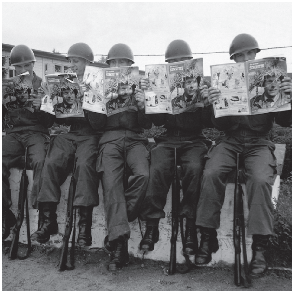
Начальные годы парламентской армии: молодые солдаты через год после создания бундесвера в 1955 году читают газету Министерства обороны «Die ersten Schritte (Первые шаги)».