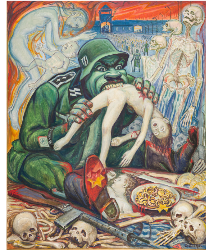
Oben: „Der Oger von Birkenau“ David Olère

Vor fünf Jahren, zum 70. Jahrestag der Befreiung des Konzentrationslagers Auschwitz, brachte der Norddeutsche Rundfunk das trimediale Projekt „Auschwitz und Ich“ in die ARD ein. Der Rundfunk Berlin Brandenburg setzt das Projekt zum 75. Jahrestag der Befreiung fort und begleitet die Ausstellung mit einer Programminitiative und der Internetseite www.auschwitzundich.ard.de .