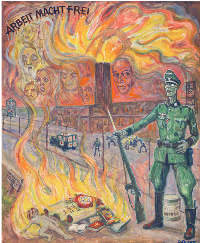
Oben: „Freiheit beginnt oben am Schornstein“ David Olère Staatliches Museum Auschwitz-Birkenau