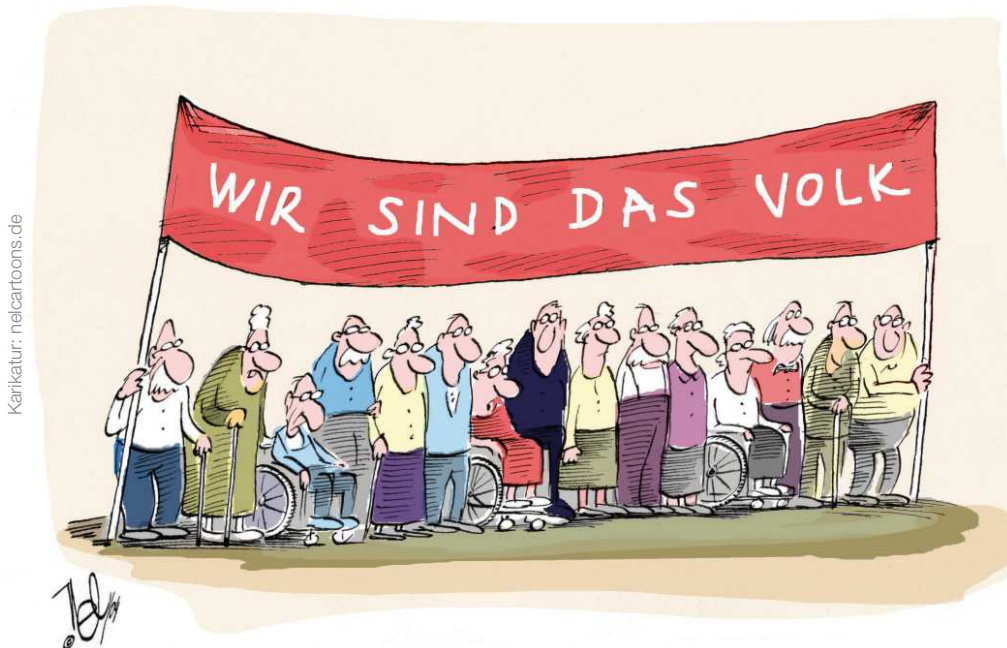
Mächtige Influencer – auch in Corona-Zeiten

Zahl der 30-45-Jährigen jedenfalls, die erfahrungsgemäß den Großteil der Innovatoren und Unternehmensgründer stellen, nimmt in Deutschland bekanntermaßen weiter dramatisch ab. Wer unter 45 sowie gut ausgebildet ist und angesichts all dieser Aussichten in Deutschland bleibt, verdient eigentlich besondere Anerkennung – und positive statt noch mehr negative Anreize.