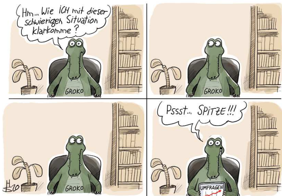
Karikatur: Heiko Sakurai

Zu würdigen sind neben der Arbeit der Bundesregierung insgesamt auch die Regierungen der Länder und Spitzen der Kommunen. Viel Kritik am deutschen Föderalismus und dem „Flickenteppich“ ist in diesen Tagen zu hören – als ob Einheitlichkeit ein Wert an sich sei. Muss es den Berliner so sehr (be-)kümmern, wenn im Saarland Geschäfte, in denen er sowieso nicht einkauft, zwei Tage früher öffnen und Schulen, die seine Kinder sowieso nicht besuchen, vielleicht eine Woche später? Es gibt jedenfalls keine Belege dafür, dass stärker zentralistisch organisierte demokratische Staaten besser durch die Krise kommen. Könnte nicht der glimpfliche Verlauf der Corona-Verbreitung in Deutschland als Sternstunde des Föderalismus und dezentraler, regionaler und kommunaler Entscheidungsstrukturen gewertet werden? Zentral getroffene Fehlentscheidungen gelten für das ganze Land, gleichzeitig sind Lern- und Korrekturprozesse schwerer. Im föderalen System der Bundesländer wurde demgegenüber um die richtigen Maßnahmen gerungen und Entscheidungen (auch im „Wettbewerb“ der Bundesländer) immer wieder nachjustiert. Gerade in unübersichtlichen und unsicheren Krisensituationen müssen temporär unterschiedliche Vorgehensweisen, kreative Experimente und voneinander Lernen nicht das schlechteste Vorgehen sein. Deutschlands Stärke, nämlich Einheit in Vielfalt, sollte also eher unterstrichen werden. Auch durch mehr Mut zu Transparenz und Wettbewerb. Die Menschen brauchen ihre