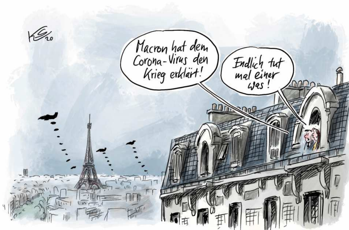
Karikatur: Klaus Stüttmann

hen noch in den Kommunen, und für einen nicht unwesentlichen Teil der Bevölkerung hierzulande war lange vor allem Toilettenpapier ein „Mangelthema“. Viele Menschen werkeln zuhause und erleben „Krieg“ im Sessel mit Netflix – oder bei einem deutschen Fernsehsender, der allen Ernstes in einer Endlosschleife unkommentierte Sequenzen von Kamerabildern aus leeren deutschen Innenstädten abspulte, mit zwei umgefallenen Heizpilzen in einem geschlossenen Biergarten als Höhepunkt der Apokalypse, dramatisch untermalt von Horrormusik aus dem Film „The Dark Knight“.