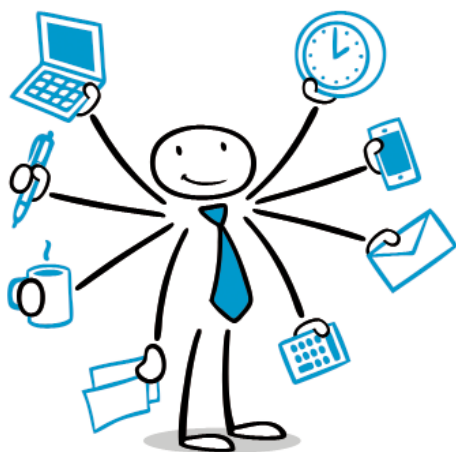
Zeichnung: Robert Kneschke

zu kommunalen Bauverwaltungen, wo Bauanträge unnötig liegenblieben, Beamte bei vollen Bezügen betätigungslos zu Hause saßen, weil es an technischer Ausstattung für „Home-Office-Plätze“ fehlte, darf sich nicht wiederholen.