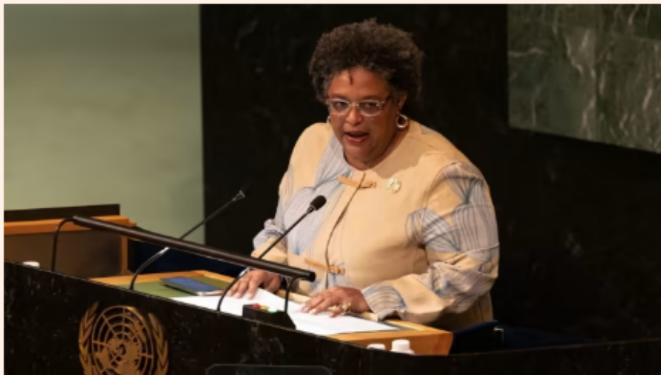
Addressing the UN general assembly this week, Barbadian prime minister Mia Mottley, is leading a push for a rethink of how the world pays for the effects of climate change.

Aime Williams in New York SEPTEMBER 24 2022